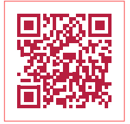
Rapport annuel (en allemand)

Nous faisons le point : ici en bref, dans le rapport annuel (en allemand, disponible sur www.foodwaste.ch/jahresbericht ) de manière détaillée. Nous vous remercions sincèrement pour votre soutien actif, que ce soit en tant que Foodsaver, collaborateur temporaire, partenaire de projet et de financement, donateur, client et, bien sûr, membre. Nous adressons des remerciements particuliers à l'OGG Bern et à SEEDLING pour leur généreux soutien financier à long terme.